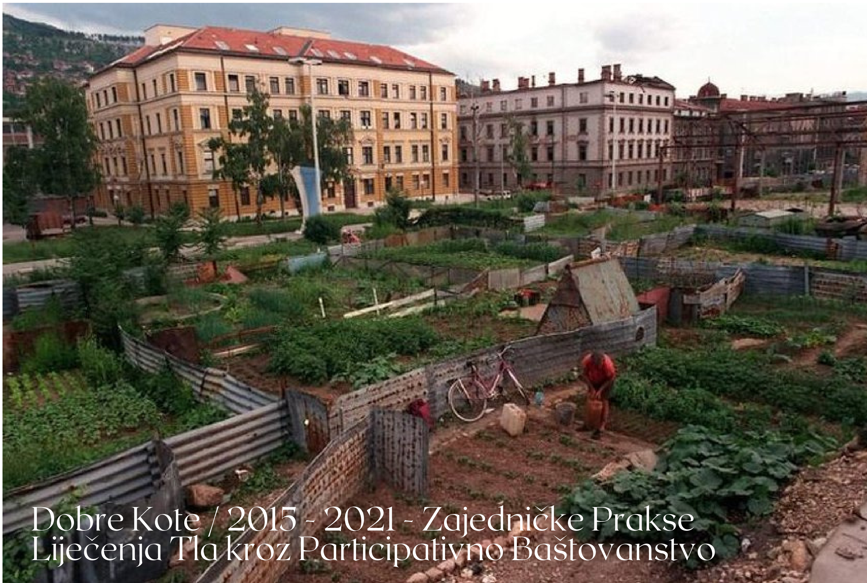
Dobre Kote / 2015 - 2021 - Zajedničke Prakse Liječenja Tla kroz Participativno Baštovanstvo